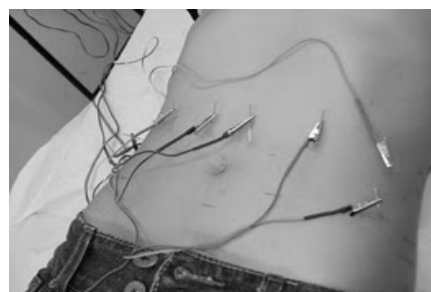
Figura 4 – Eletroacupuntura

Estimulação elétrica dos pontos de acupuntura.