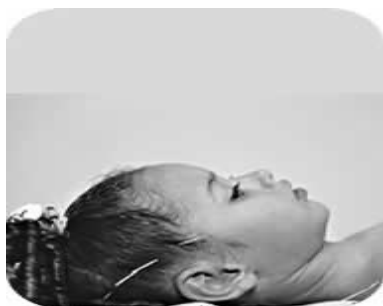
Figura 7 – Craniopuntura

Estimulação energética através do Do-In, Shiatsu, Tui-Na e Reflexologia.