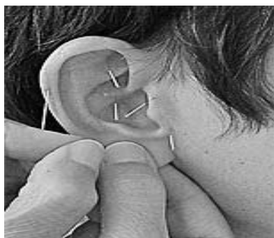
Figura 8 – Acupuntura Auricular

Harmonização das funções orgânicas por meio de estímulos no pavilhão auricular.