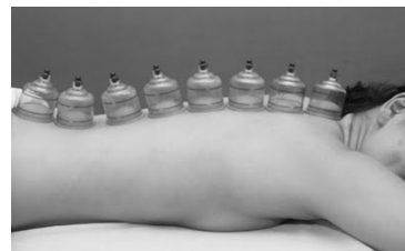
Figura 2 – Ventosaterapia

Aplicação de pressão negativa, na superfície da pele, para descongestionar a energia nos meridianos.